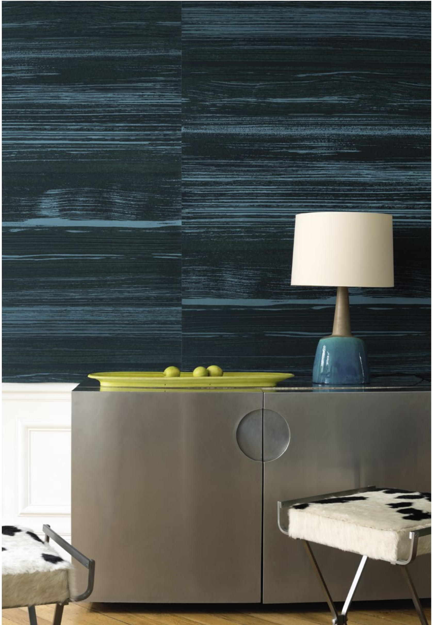
RM 1024 67