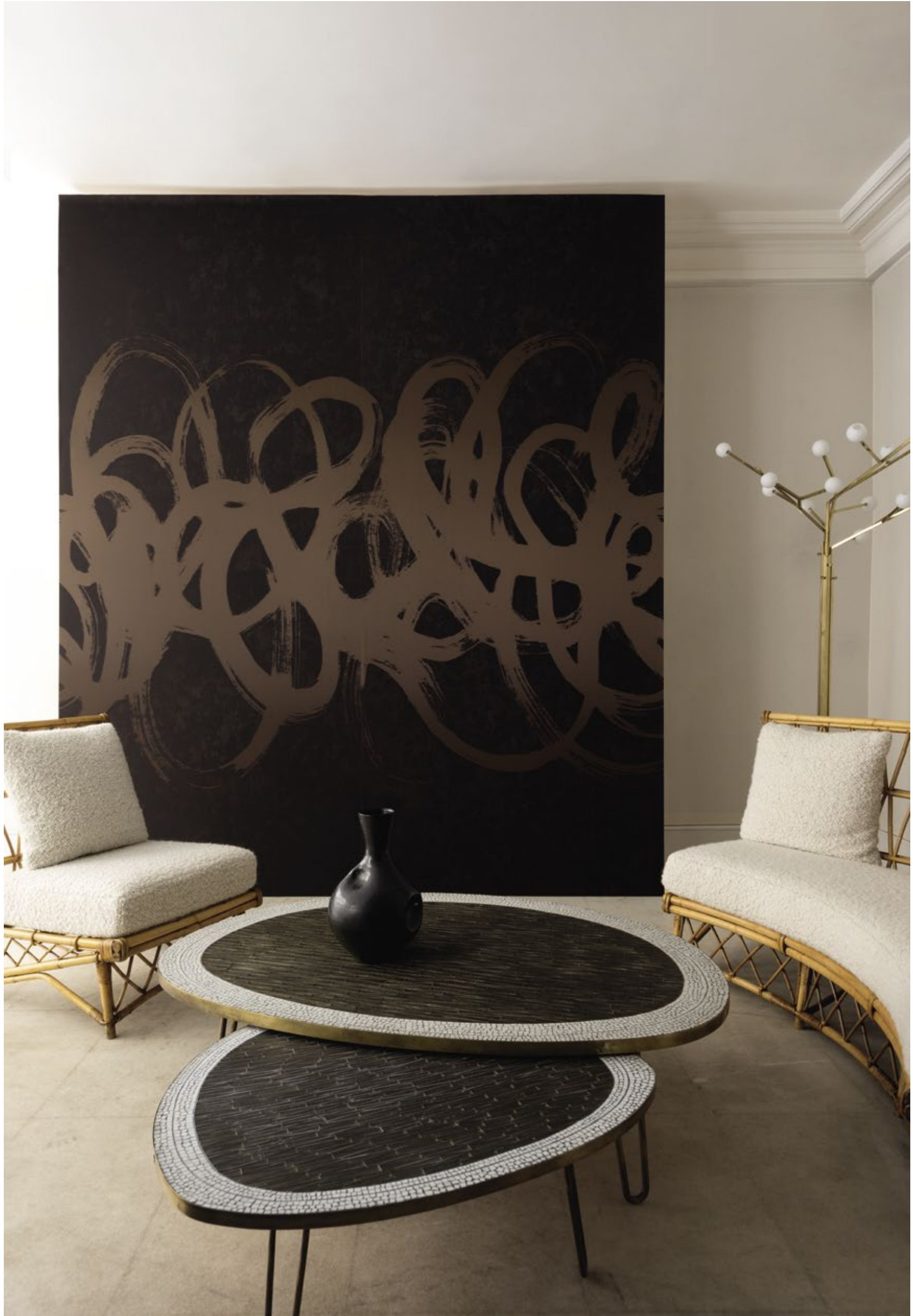
RM 1025 75