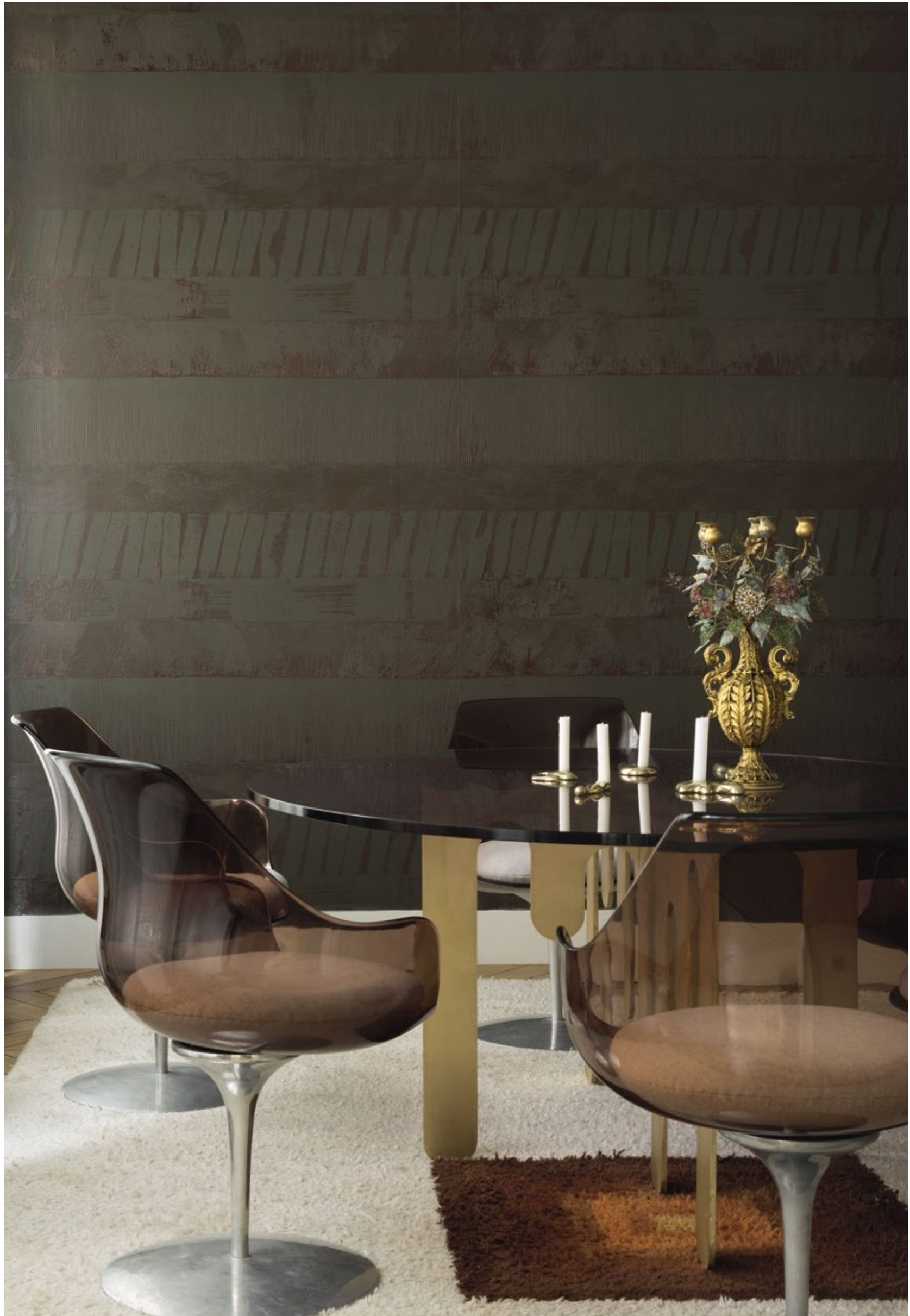
RM 1022 65